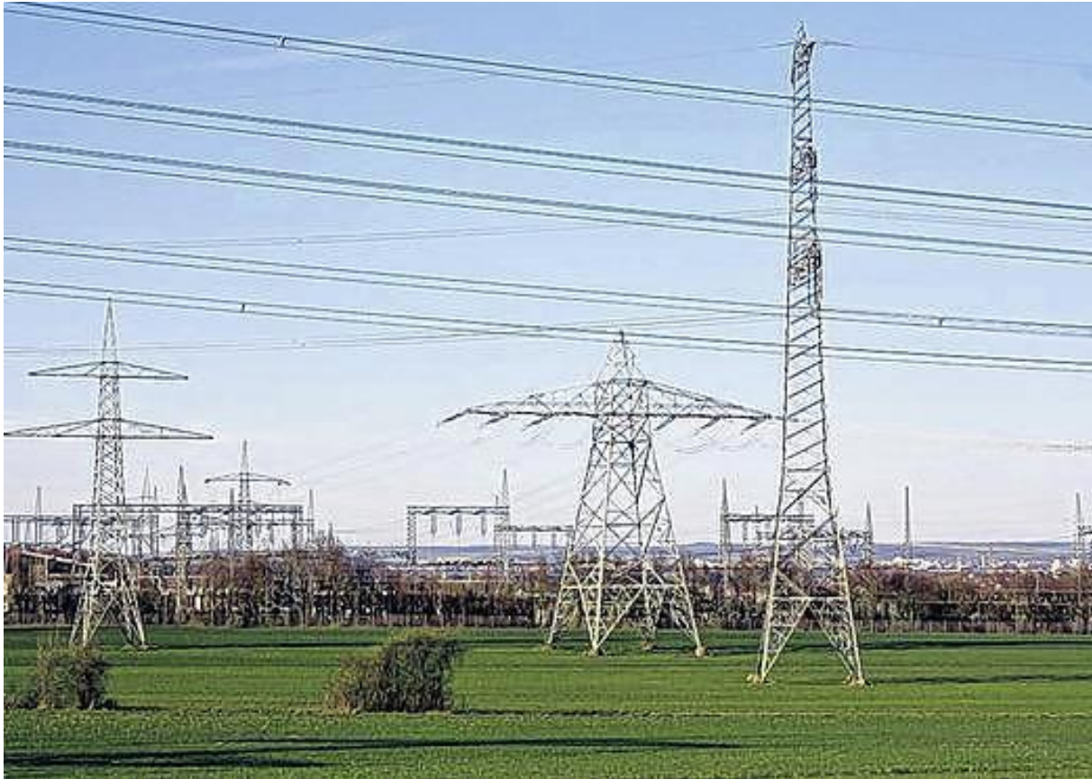
Abbildung 3: Landschaftsbild vom Umspannwerk Bergrheinfeld

Der Bereich Grafenrheinfeld–Bergrheinfeld ist seit Jahrzehnten, unter anderem aufgrund des Atomkraftwerkes (AKW) Grafenrheinfeld, ein überregional bedeutender Knotenpunkt für das Höchstspannungsnetz des Übertragungsnetzbetreibers Tennet. An diesem Knotenpunkt laufen mehrere Freileitungen zusammen, wodurch das Landschaftsbild seit Jahrzehnten durch große 380 kV-Freileitungen geprägt ist (vgl. Abbildung 3 ).