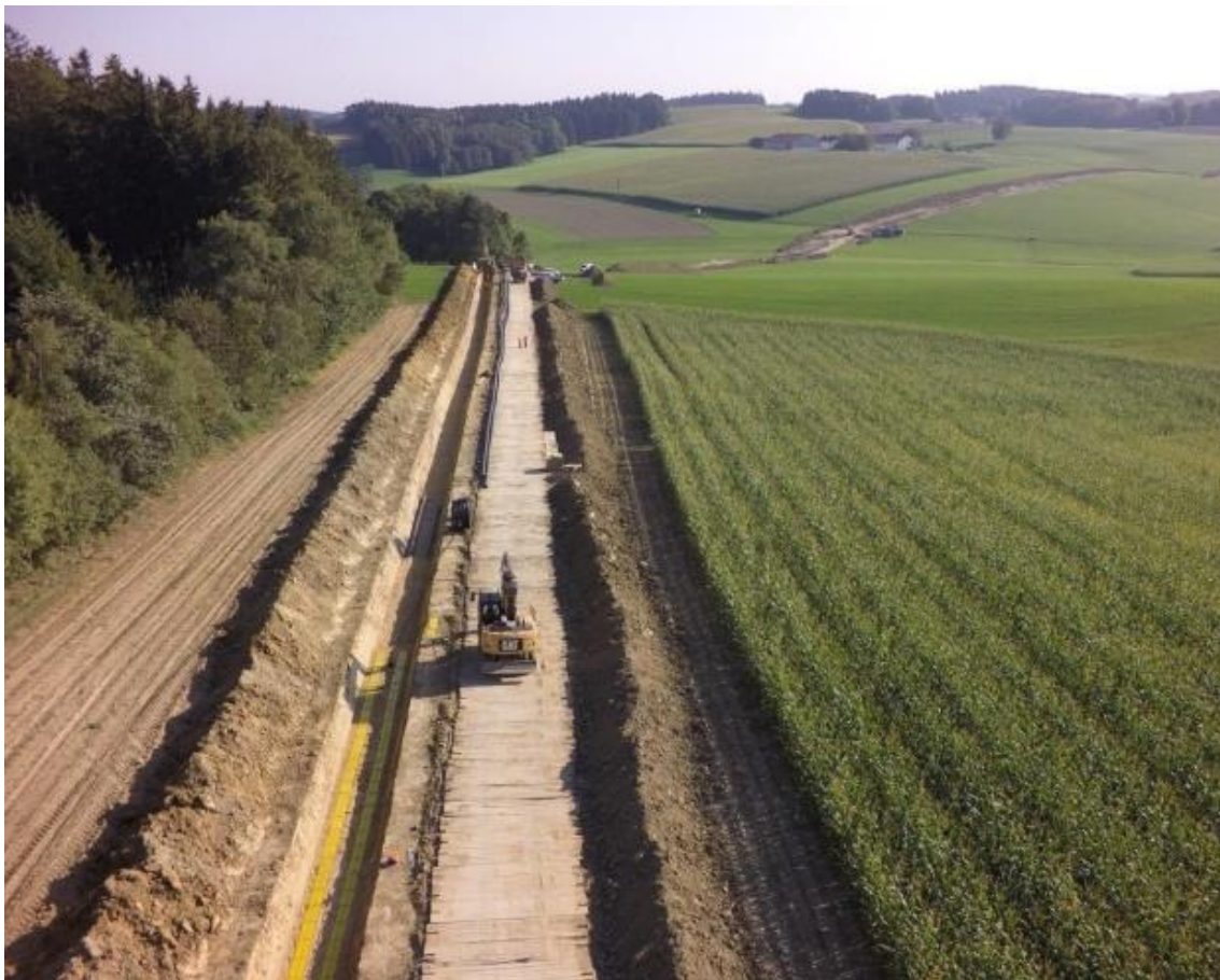
Abbildung 2: Verlegung von zwei 110 kV Kabelsystemen

Nach der Fertigstellung ist ein Schutzstreifen von ca. 20 Metern notwendig. Diese Schutzzone ist durch regelmäßige Pflegearbeiten von Gehölzstrukturen freizuhalten, um einen gefahrenfreien Leitungsbetrieb zu gewährleisten. Dies gilt vor allem für tiefwurzelnde Pflanzen. Die Leitungstrasse muss an allen